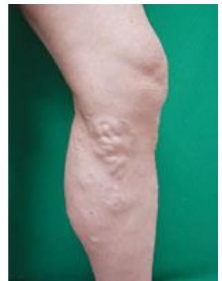
下肢静脈瘤の症例 2