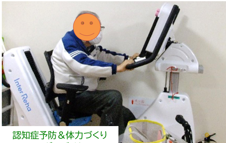
認知症予防&体づくり コグニバイク