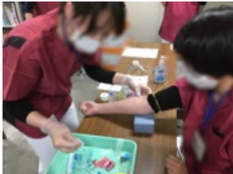
手袋をしながら駆血帯を巻くの 何度もチャレンジ