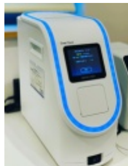
スマートジーン(PCR法)

NEAR法はPCR法より若干精度は劣りますが、陽性疑いの強い場合、念のためにPCR法でも再検査をして結果確認を行っています。どの検査も100%ではありませんので、診察と合わせて総合的に判断されます。