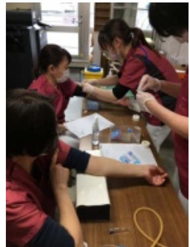
ここと決めたら、迷わず思い切り、 えいやあと刺します