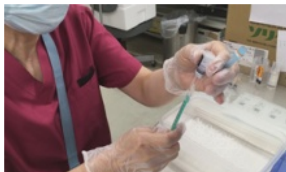
ワクチン準備中の看護師

まず手指を消毒し、手袋を着けた上で、ワクチンの有効期限のほか、容器やふたの損傷、異物混入の有無や薬の状態を目視で確認します。ファイザー製は希釈が必要なため、生理食塩水1.8mlを注射筒に入れ、ワクチン容器に注入。ゆっくり何度か容器を逆さまにする動作を繰り返します。希釈された状態の容器から接種液0.3mlを別の接種用注射筒内に吸引し、1つの小瓶から6回分のワクチンを準備します。「神経は使いますが、慣れれば大丈夫です」。患者さんに安心してもらえるように正確な作業を徹底し、ダブルチェックしながら準備します。日曜は午前午後ともに接種時間が設けられているため、接種とワクチンの準備を同時に進めていきます。