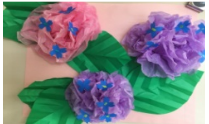
こちらは4階病棟の作品です