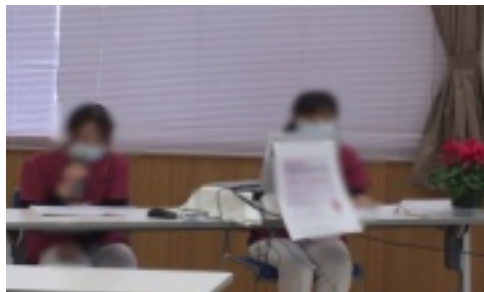
← 1年目看護師の2人と 司会の4階病棟看護師 ↓